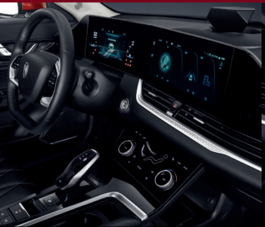
شاشة مزدوجة بمقياس 12.3 بوصة + 7 بوصة تعمل باللمس للتحكم بالتكييف Double écran de 12,3 pouces + écran tactile de climatisation de 7 pouces