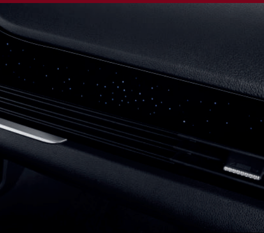
إضاءة ليلية Éclairage d'ambiance