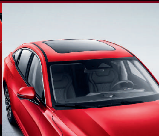
سقف بانورامي قابل للفتح Toit ouvrant panoramique