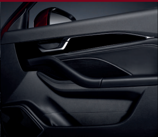
حياكة داخلية بتصميم عصري Tricot intérieur au design moderne