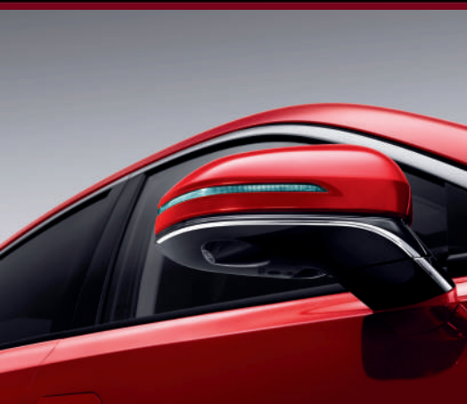
مرآة جانبية قابلة للطي Rétroviseur rabattable