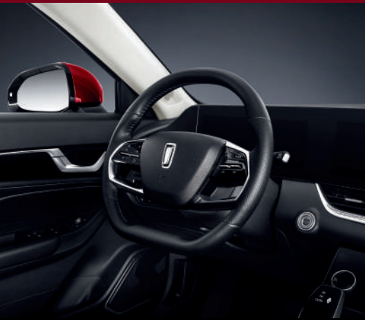
مقود متعدد الوظائف Volant multifonction