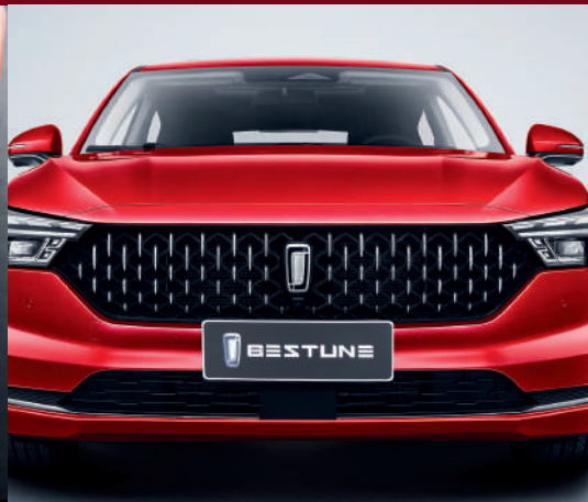
شبكة فريدة على شكل قطرة المطر Grille unique en forme de goutte de pluie