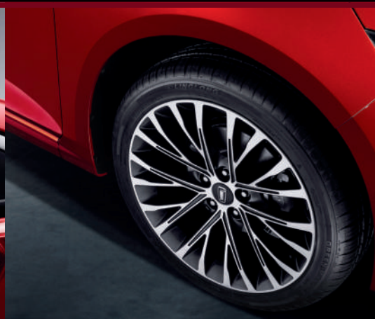
جنوط متوفرة بقياس 18 انش Jantes alliage disponibles en 18 pouces