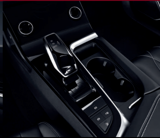
ناقل حركة أوتوماتيكي 7 سرعات Boite de vitesses automatique 7DCT