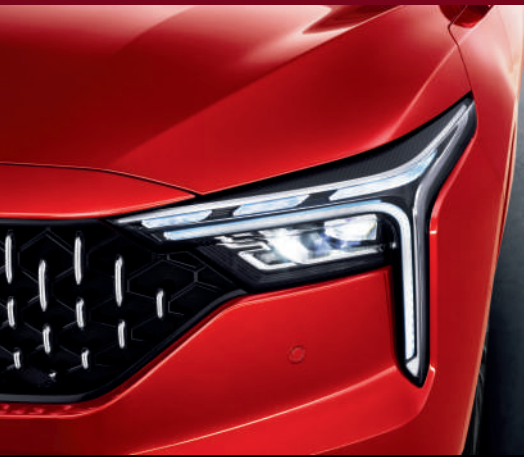
مصابيح أمامية بتصميم Dagger Axe Phares avant avec un design Dagger Axe