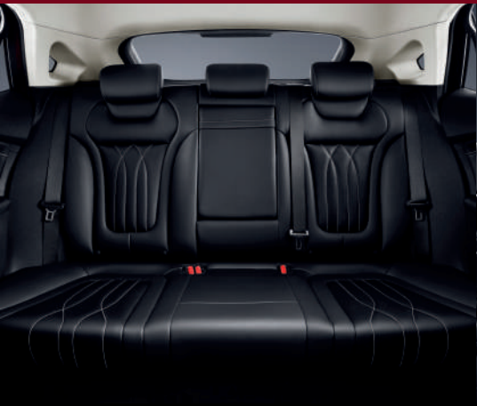
مساحة داخلية واسعة intérieur spacieux