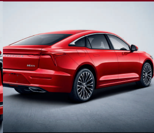
تصميم انسيابي لخطوط السيارات Lignes et design fluides