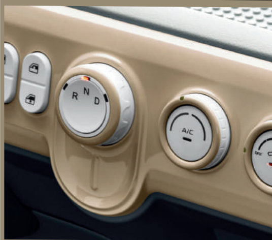
ناقل حركة أوتوماتيكي كهربائي بسرعة واحدة