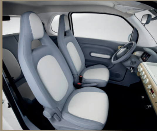
مقاعد من قماش