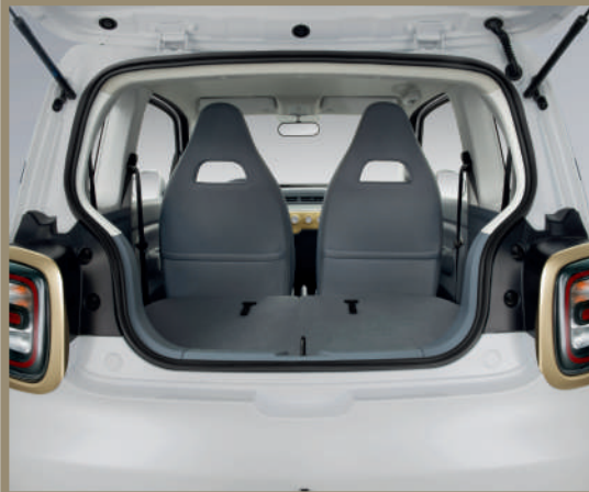
صندوق أمتعة واسع بفضل المقاعد الخلفية القابلة للطي