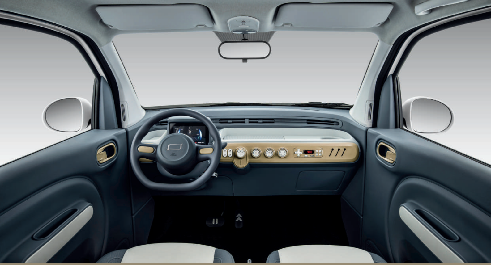
Siège en tissu