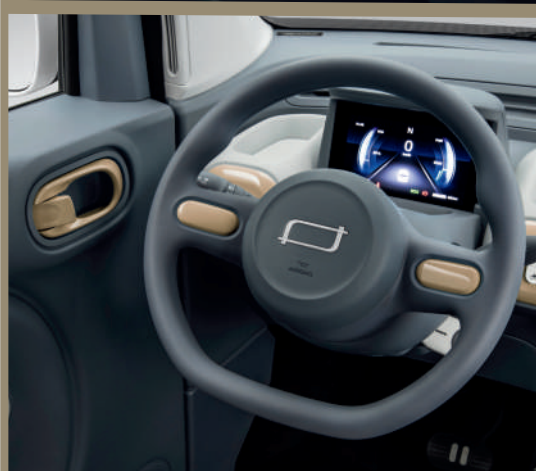
شاشة قياس LCD بمقاس 7 بوصات