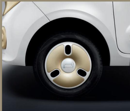
جنوط متوفرة بقياس 12 انش