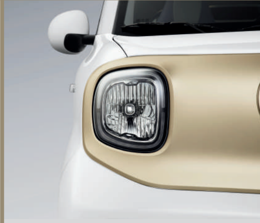
المصابيح الأمامية LED