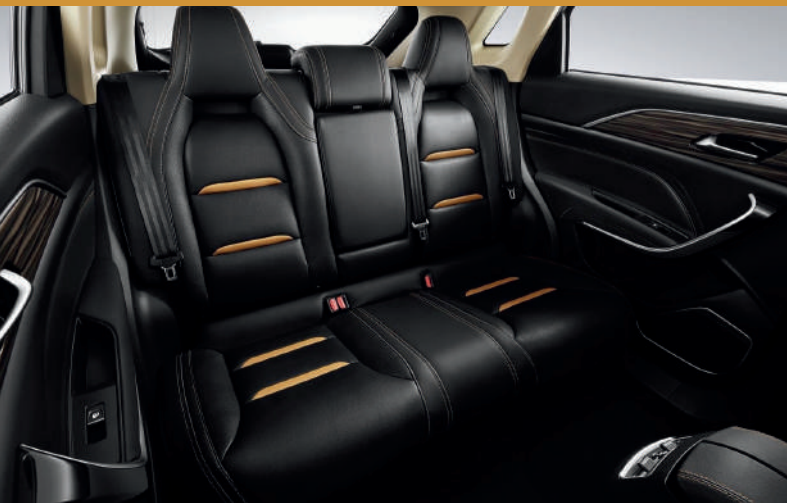
مساحة داخلية واسعة intérieur spacieux