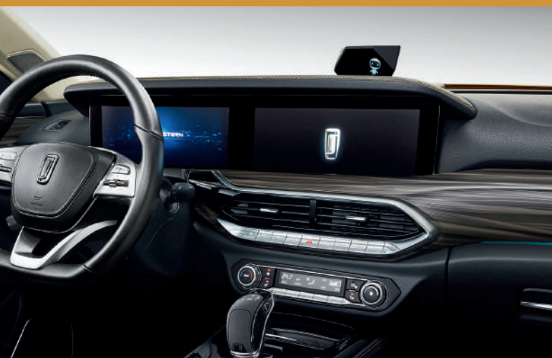
شاشة مزدوجة بمقياس 12.3 بوصة Double écran de 12,3 pouces