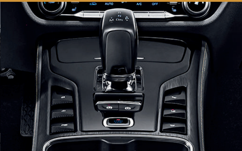
ناقل حركة أوتوماتيكي 7 سرعات Boite de vitesses automatique 7DCT